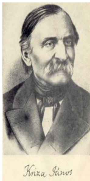
6. kép Kriza János, későbbi unitárius püspök (Nagyajta, 1811. június 28. – Kolozsvár, 1875. március 26.)