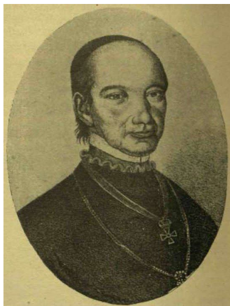
5. kép Kovács Miklós (Tusnád, 1769. január 16. – Kolozsvár, 1852. október 15.), erdélyi római katolikus püspök