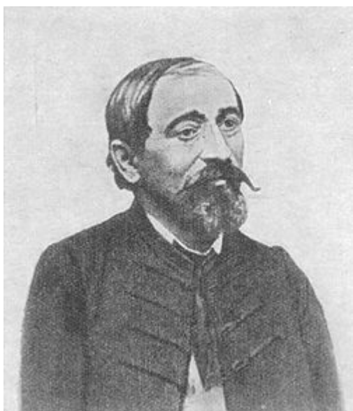
3. kép Irinyi János (Albis, 1817. május 18. – Vértes, 1895. december 17.)