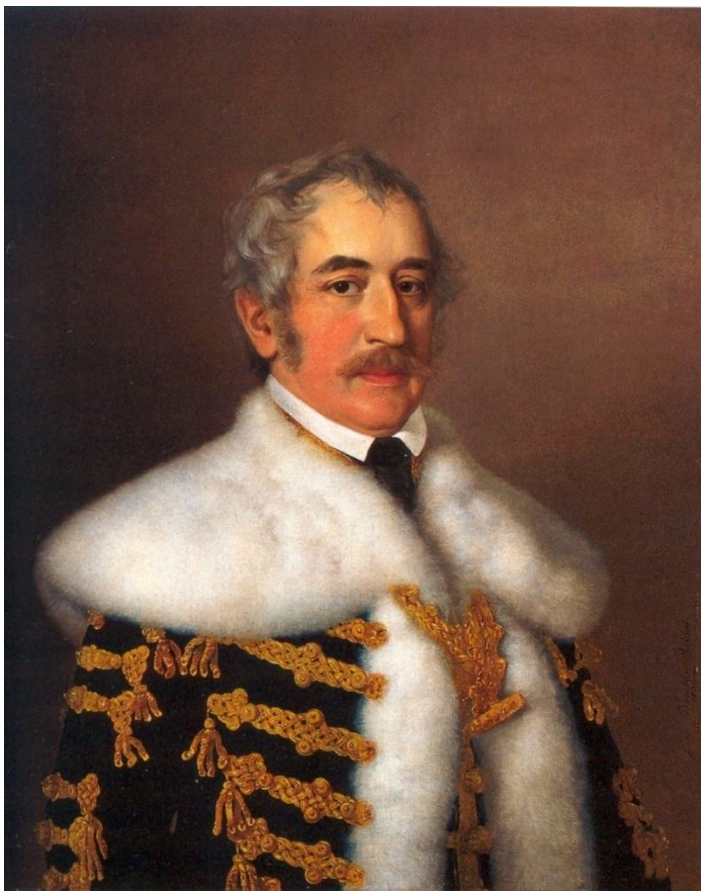
2. kép Teleki József (1790-1855), az Akadémia elnöke. Barabás Miklós festménye