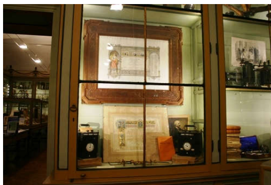
2. kép Enrico Bottini munkásságát bemutató vitrin a paviai Egyetem Orvostörténeti Múzeumában

kiegészített karbolsavas (fenolos) keverékek belsőleg való használatától sem, például a bélférgesség különféle formáiban, krónikus hasmenés esetén. Állatgyógyászati szerként is ajánlotta. A kötet végén a párizsi gyógyszerésztestület jóváhagyásával összeállított recepteket is közölt. A karbolsavat Lemaire sosem használta hígítás nélkül, és általában csak néhány cseppnyit alkalmazott. 5