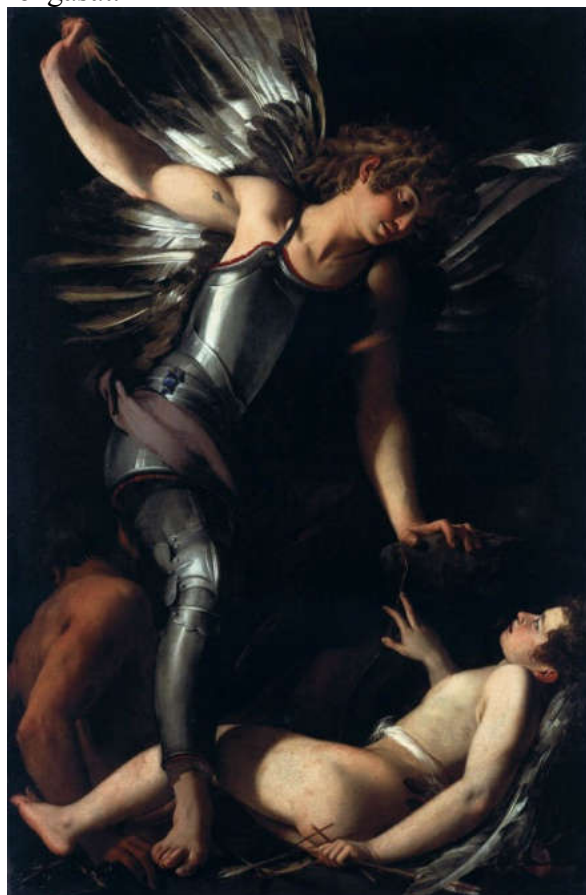
3. ábra BAGLIONE, Giovanni: Heavenly Love and Earthly Love

Az érzéki szépség és az érzékek feletti szépség ismét egy-egy fogalompár, a női- és férfi szépség pregnáns megfogalmazása. A külső szépség, amely az érzékekre hat, vagyis a női szépség és a férfiaké, az érzékek feletti, vagyis a jó és a bölcsesség, az isteni szépség, amely a belső ragyogást jeleníti meg, a „Legfőbb Jó” ragyogását. Dualitás itt is tettenérhető, a kozmosz egysége is: az isteni szépség (férfi), nemcsak az emberi teremtenyekben (női-mikrokozmosz) hanem a természetben is jelen van. 14 A reneszansz festészetben a Venuszok, mint földi, megfogható hús-vér nők, az égi szerelem földi szerelem, vagy csak másai egyértelműen mutatja a férfi-női kapcsolat aránytalanságát. Baglione festményén a férfi kemény, acélosan fényes, teljes testét fedő páncélban épp leszáll az égből, s már nyúl széttárt, megfogásra (megragadásra?) kész kezével - mint egy nagytestű (ragadozó)madár karmaival - a fekvő, meztelen, riadt és tehetetlen nő felé. Azonban a férfi arca mutatja érzelmeit, meglágyítja céltudatos mozgását.