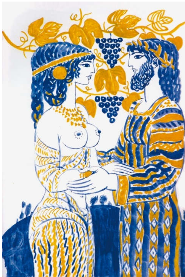
2. ábra Reich Károly illusztrációja az Énekek Énekéhez

A test szépségének megjelenítése - a művészi ábrázolások összes ellentmondásával együtt - a képzőművészet egyik alaptémája. Az ó- és középkorból fennmaradt szobrok többnyire márványból készültek, csodás arányokkal sima, csillogó felülettel, lágy hajlatokkal - az aranymetszés szabályainak és arányainak megfelelően. Nagyon találó Victor Hugo véleménye a szép márvány test értékeléséről: „A régiek a márványhoz hasonlították a női testet: ez a kép teljesen hamis. A test szépsége éppen az, hogy nem márvány. Mert reszket, remeg, pirul, vérzik. Kemény, merevség nélkül. Fehér, de nem hideg. Megborzong és elbágyad. A test az élet; a márvány a halál.”