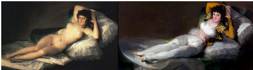
4. ábra Fransisco Goya: meztelen Maya, 1799-1800